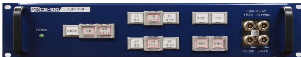
写真は同軸切替器入出力前面タイプ