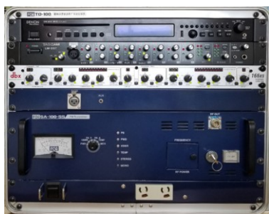
カバーオープン時