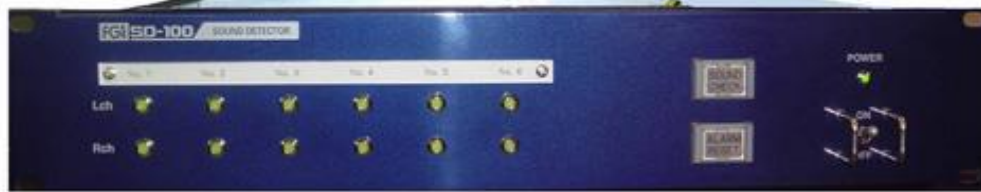
写真は回路数6チャンネル