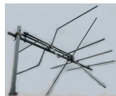
FMラジオ全帯域（76～95 MHz） 送受信アンテナ